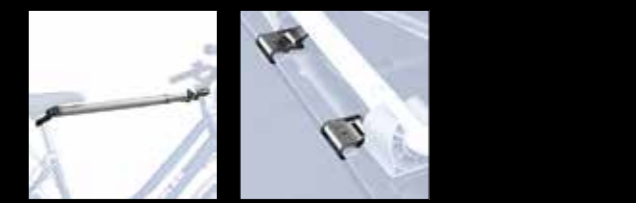
ART. 395 ADATTATORE DONNA/UOMO REMOVABLE CROSSBAR AVAILABLE SEPARATELY ART. 955 ATTACCO RIGIDO SUPERIORE (art. 620 - 625) RIGID TOP FIXING BRACKETS (art. 620 - 625)