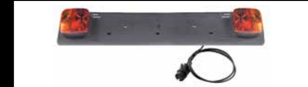
ART. 394 PORTATARGA COMPLETA DI FANALI E SPINA 7 POLI LUNGHEZZA CAVO: 1,5 MT NUMBER PLATE HOLDER COMPLETE WITH LIGHTS AND 7 PIN PLASTIC PLUG CABLE LENGTH: 1,5 MT