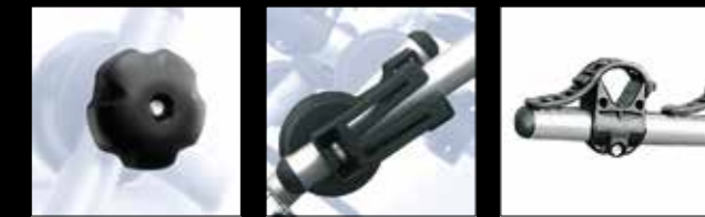
CHIUSURA CON POMELLO (DI SERIE PER ART. 625 - 626, A RICHIESTA PER ART. 620) CLOSE-UP WITH KNOB (AVAILABLE FOR ART. 625 - 626, ON REQUEST FOR ART. 620) CHIUSURA A LEVA CON BLOCCAGGIO (DI SERIE PER ART. 620, A RICHIESTA PER ART. 625) CLOSE-UP WITH LOCKING LEVER (AVAILABLE FOR ART. 620, ON REQUEST FOR ART. 625) BLOCCAGGIO SINGOLO SINGLE BLOCKING