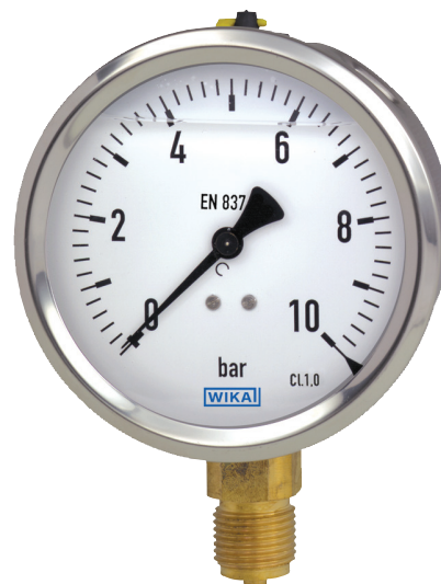
Манометр с трубкой Бурдона, Модель 213.53.100, снизу