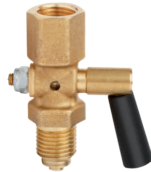
Запорный кран Внутренняя/внешняя резьба G 1/2/G 1/2 B, DIN 16261, PN 25