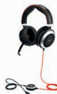
Jabra Evolve 80 MS stereo