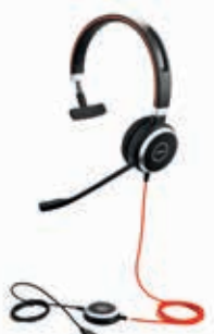
Jabra Evolve 40 Mono и Duo 3