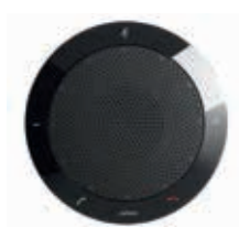
Jabra SPEAK 410