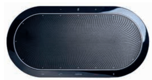
Jabra SPEAK 810