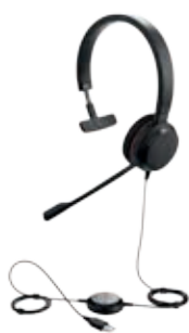
Jabra Evolve 20 Mono и Duo 3