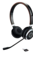
Jabra Evolve 65 Mono и Duo 3