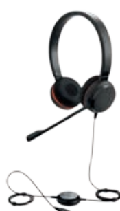
Jabra Evolve 30 Mono и Duo 3