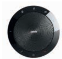
Jabra SPEAK 510