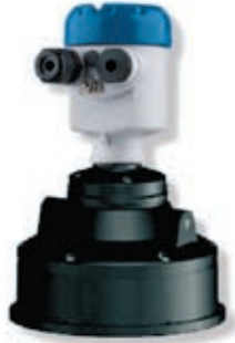
OPTISOUND 3030 C