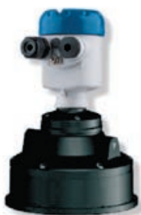
OPTISOUND 3030 C