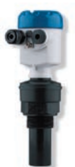
OPTISOUND 3010 C