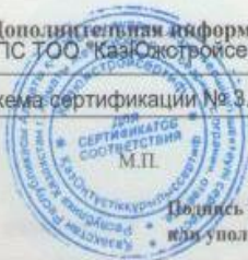
Схема сертификации № 3. СТ ИП 830917300315-01-2009.

Подпись руководителя органа по подтверждению соответствия или уполномоченного им лица