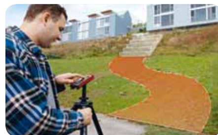
Измеряемые точки и области