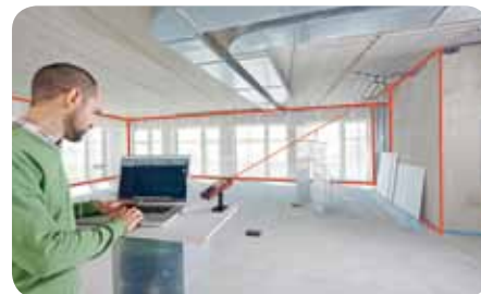
Передача координат точек в реальном времени