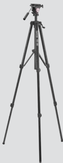
Штатив Leica TRI 100 Арт. № 757 938