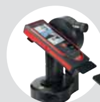
Адаптер Leica FTA360-S Арт. № 828 414