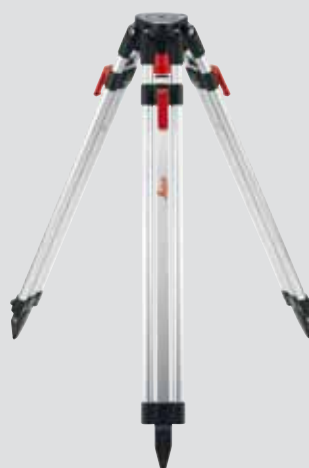
Штатив Leica TRI 200 с резьбой 1/4" Арт. № 828 426