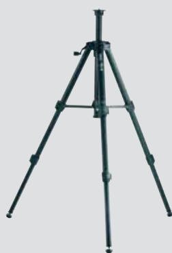
Штатив Leica TRI 70 Арт. № 794 963